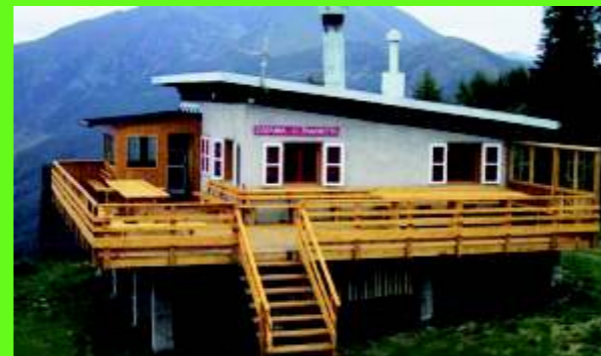
Capannina Sci Club Panarotta

Si ringrazia chiunque contribuisca alla buona riuscita della manifestazione.